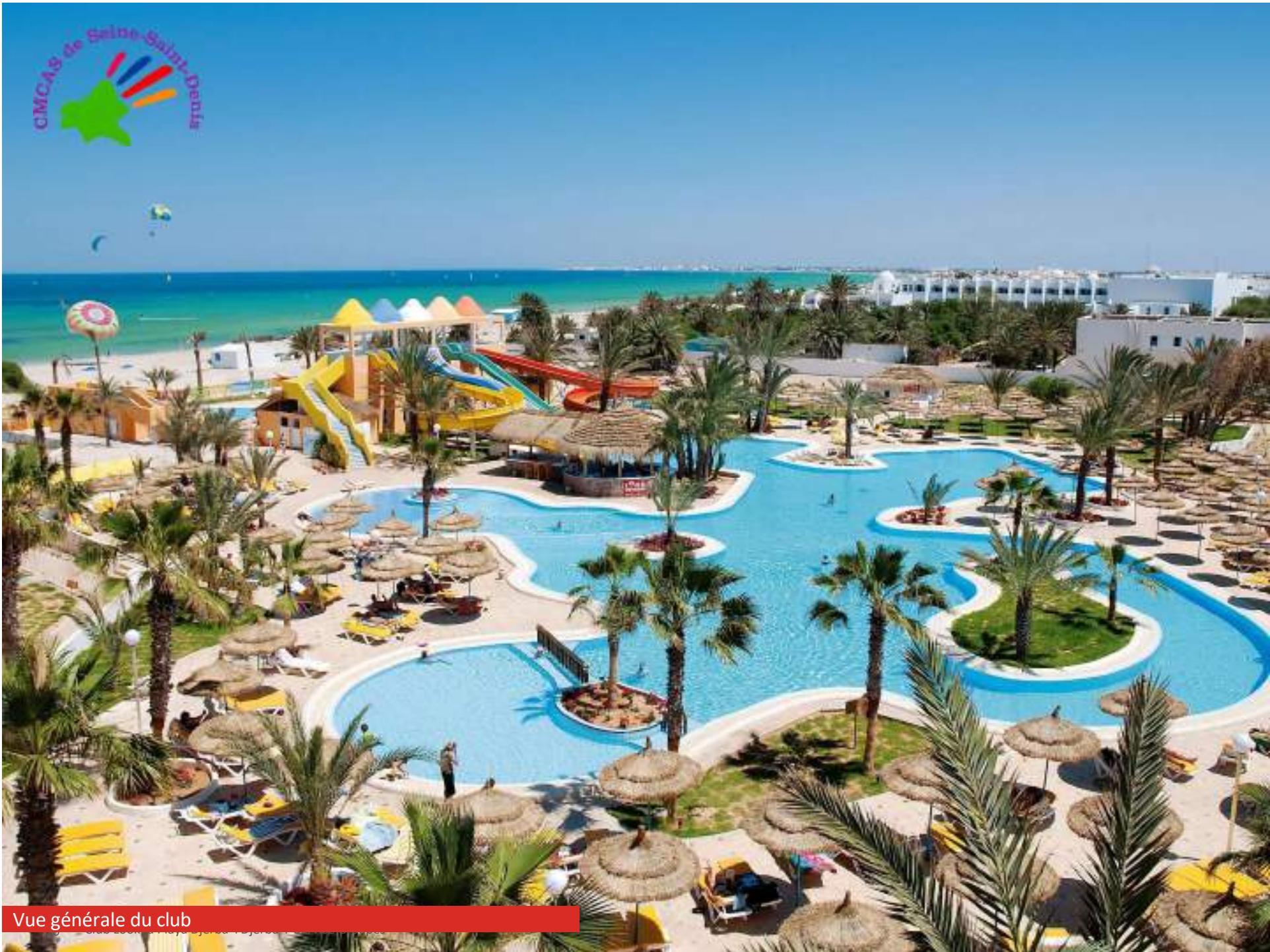
Vue générale du club