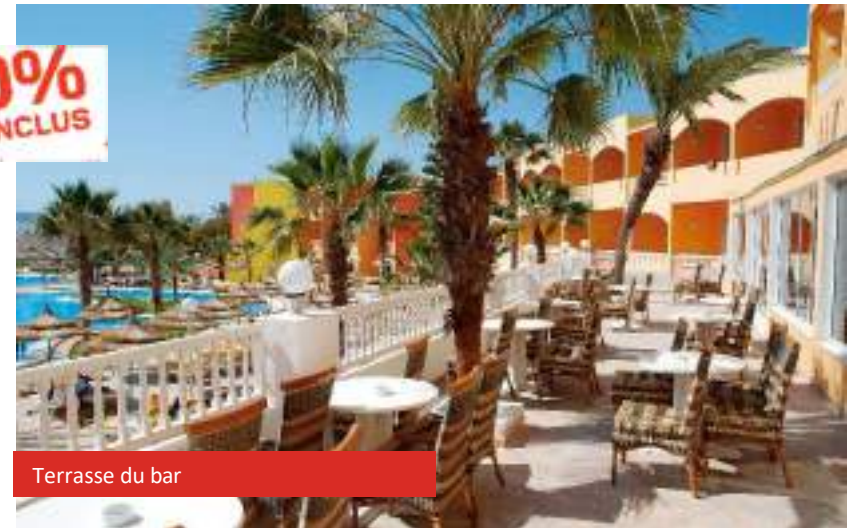
Terrasse du bar