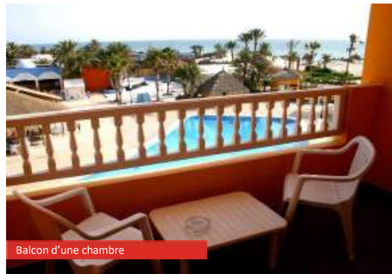
Balcon d'une chambre

* À partir de 12 ans, l'enfant est considéré comme un adulte