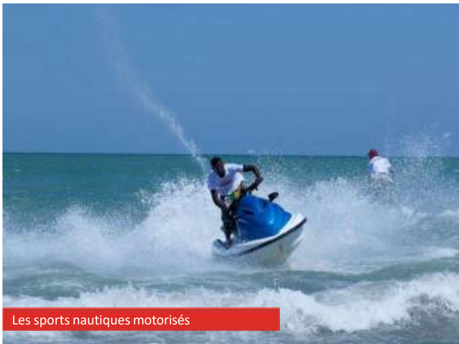
Les sports nautiques motorisés