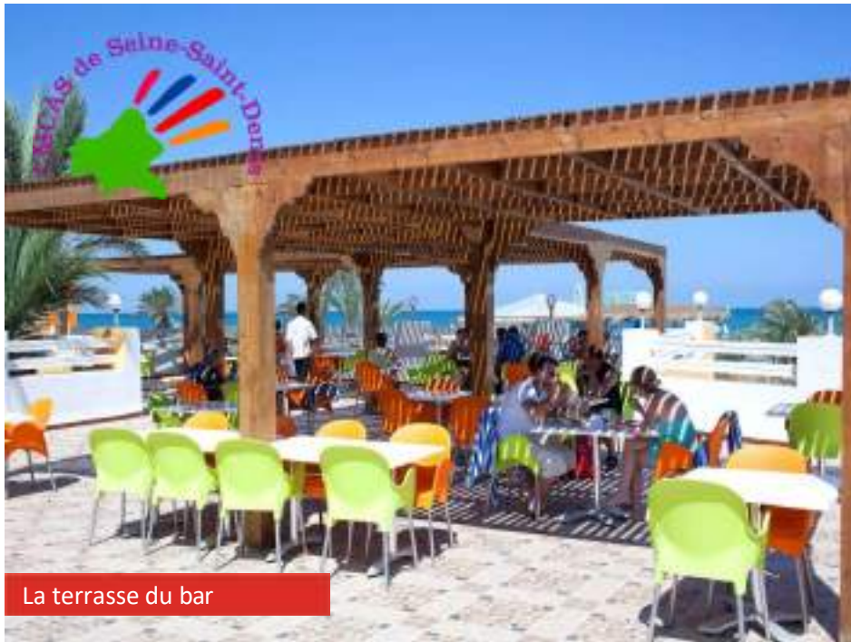
La terrasse du bar